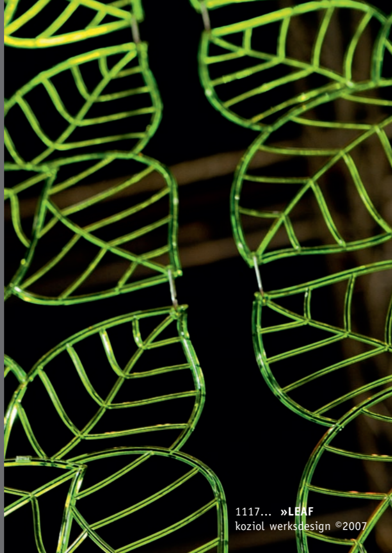
1117... »LEAF koziol werksdesign ©2007