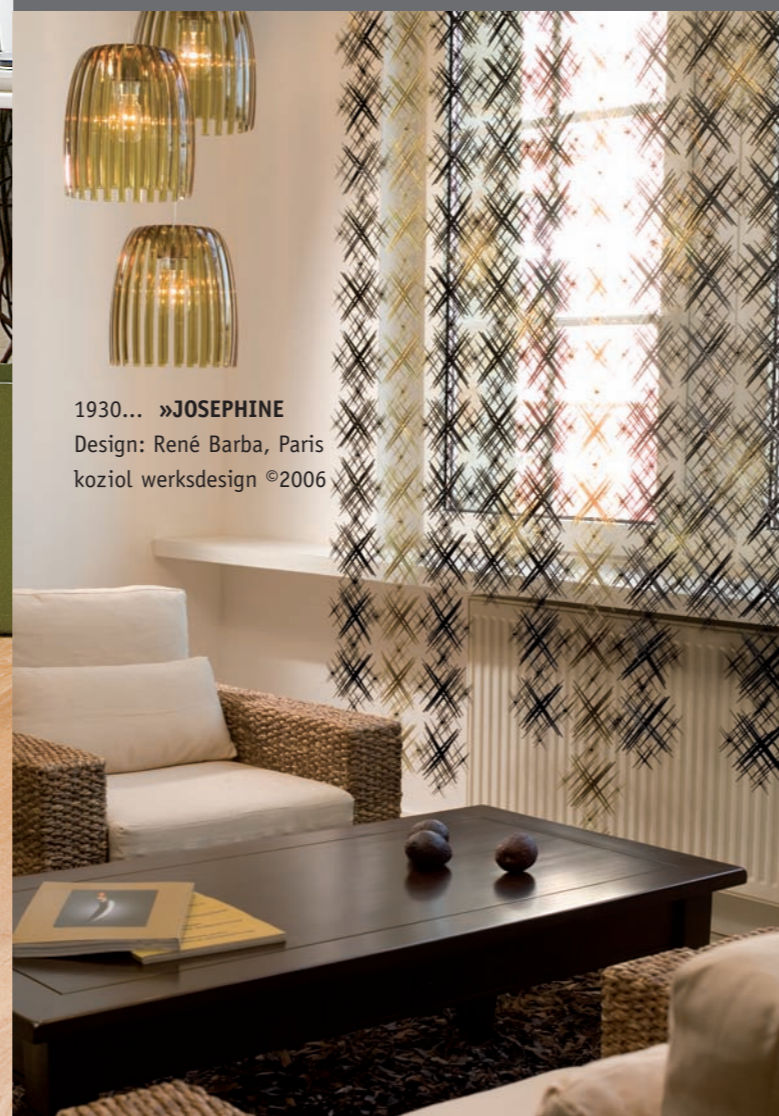
1930... »JOSEPHINE Design: René Barba, Paris koziol werksdesign ©2006