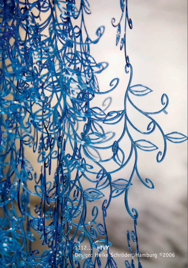
1112... »IVY Design: Heike Schröder, Hamburg ©2006