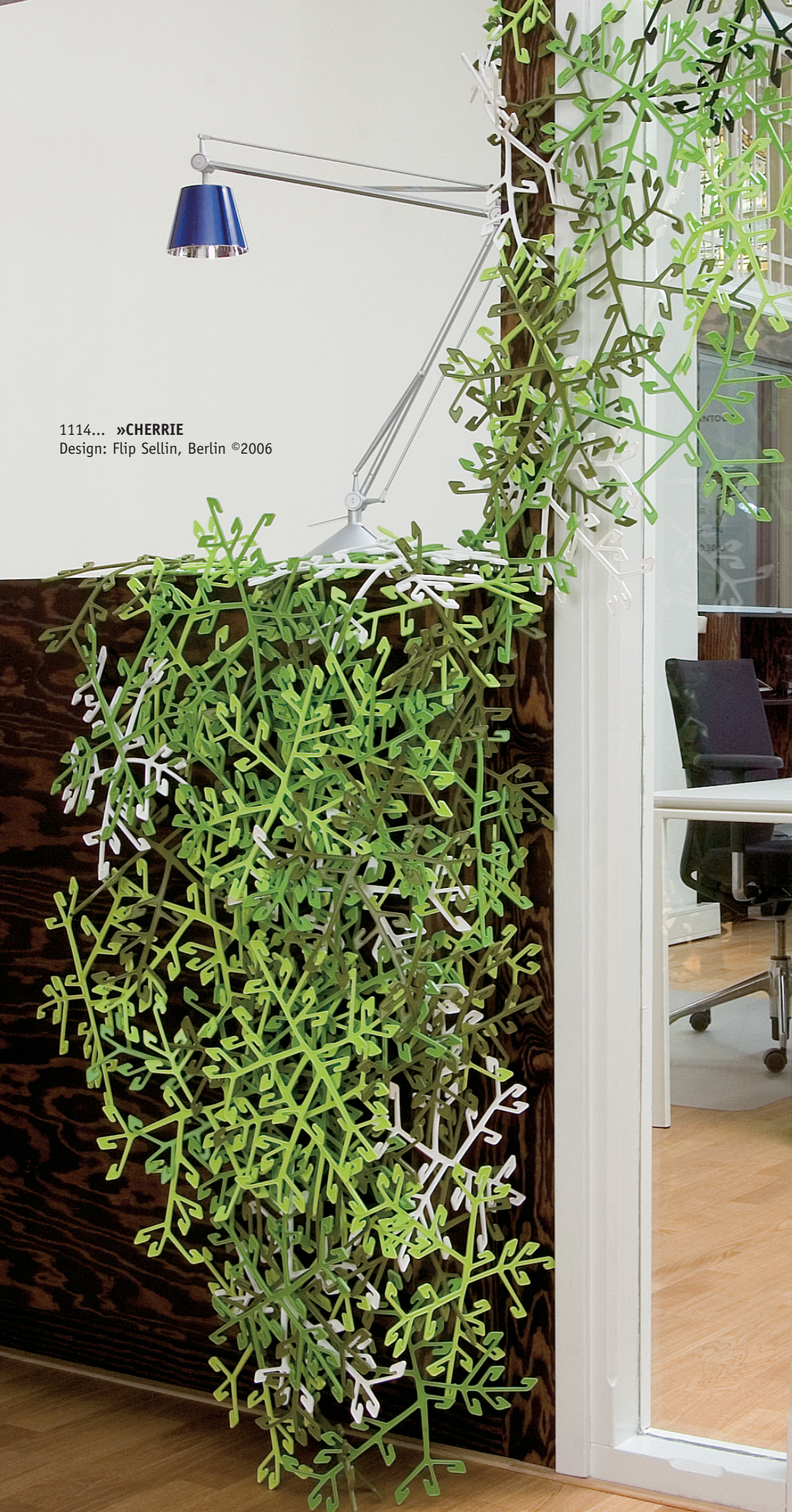
1114... »CHERRIE Design: Flip Sellin, Berlin ©2006