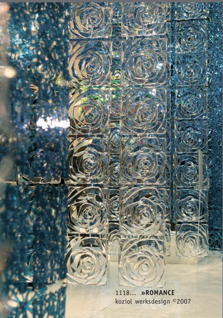
1118... »ROMANCE koziol werksdesign ©2007