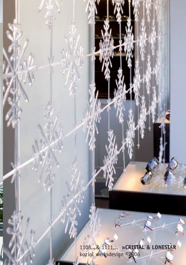
1108... & 1111... »CRISTAL & LONESTAR koziol werksdesign ©2006