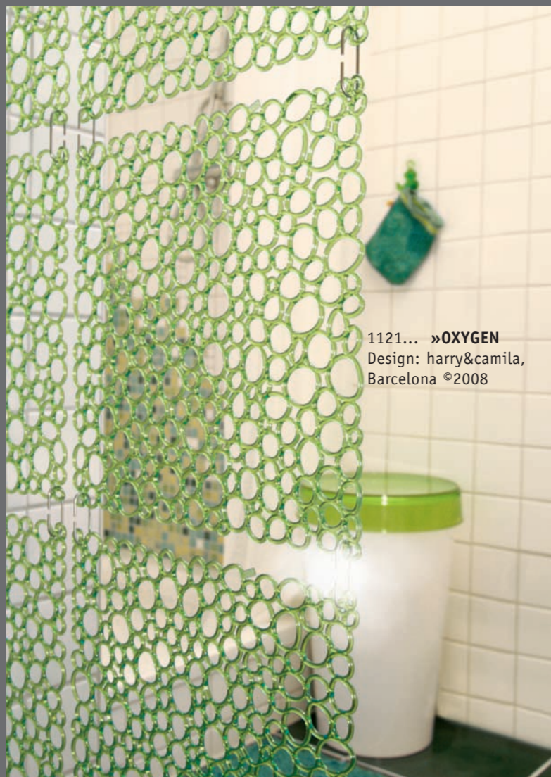
1121... »OXYGEN Design: harry&camila, Barcelona ©2008