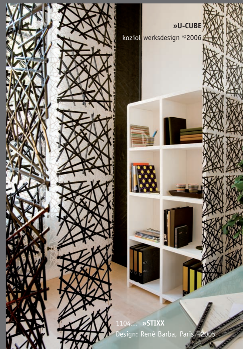
»U-CUBE koziol werksdesign ©2006